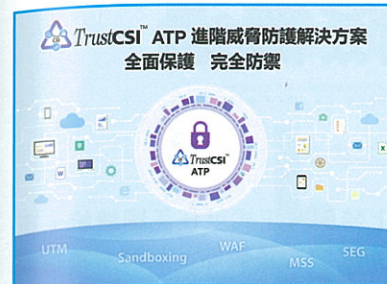
TrustCSI™ ATP進階威脅防護服務。

對於中信國際電訊CPC來說，過去一年可謂大展鴻圖，只因公司在2016年4月宣布收購Linx Telecommunications旗下電訊業務，成為業界一時佳話。收購行動於2017年2月初取得監管部批准完成收購。中信國際電訊CPC稱兩間公司一直秉持相同理念，希望憑藉雙方在電訊