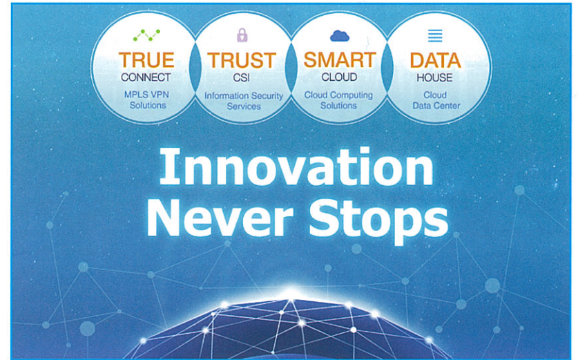
中信國際電訊CPC秉持「創新·不斷」的經營理念。

階持續性滲透攻擊(APT)，中信國際電訊CPC推出TrustCSI™ ATP進階威脅防護(Advanced Threat Protection, ATP)服務，此服務能無縫監察檔案、電郵、網絡流量及網絡應用等層面的可疑活動，透過SOC並利用先進SIEM技術，將數據及資料庫作關聯分析，加上安全專家作24x7實時管理監控，主動發送通知並消除威脅，應對跨基礎架構層上的各種威脅，及早阻截各類攻擊。